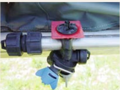
Obr. č. 14: Nízkoúletové trysky

Minimalizaci nežádoucích úletů při aplikaci přípravků lze ovlivnit vybavením aplikačních zařízení speciálními technickými opatřeními a použitím zejména protiúletových trysek. SRS připravuje systém protiúletových opatření a přehled klasifikovaných zařízení redukujících nežádoucí úlet.