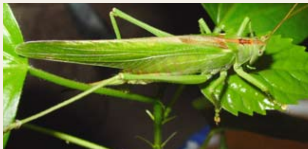
Obr. č. 12: Kobylka zelená Tettigonia viridissima je býložravec a saprofág, ale je rovněž významný přirozený regulátor živočišných škůdců – živí se hmyzem

Při testování rizika pro necílové členovce je zkoumán pouze omezený počet čeledí, které jsou standardně považovány za nejcitlivější modelové druhy. Z toho vyplývá, že pokud je přípravek označen jako nebezpečný pro jednu čeleď, může být potenciálně nebezpečný i pro jinou, netestovanou čeleď.