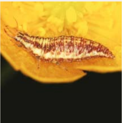
Obr. č. 11: Pokud používáme selektivní přípravky a dodržíme zásady správné aplikace, uchráníme např. i užitečné členovce – larva zlatoočky obecné Chrysoperla carnea – významný predátor mšic