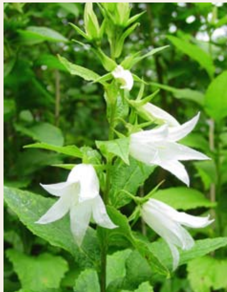
Obr. č. 13: Použití přípravků může představovat riziko i pro necílové rostliny – zvonek širokolistý Campanula latifolia