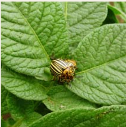
Obr. č. 10: Významný škůdce mandelinka bramborová Leptinotarsa decemlineata , proti kterému je třeba pravidelně chránit porosty brambor použitím insekticidů

Členovci, vyskytující se na pozemku, nejsou pouze škůdci, ale zastoupeni jsou také přirození regulátoři, kteří pomáhají snižovat početnost škůdců (např. sluněčka a larvy zlatooček, které se živí mšicemi) a hmyz, který neškodí ani není užitečný, ale je přirozenou součástí agroekosystémů. Údaj o riziku pesticidů pro necílové členovce má hlavní význam v integrované a biologické ochraně rostlin. Zvlášť významné postavení ve striktně definovaných systémech integrované