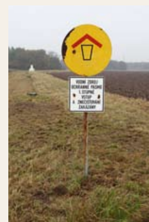
Obr. č. 5: Ochranné pásmo I. stupně, které je obklopeno ochranným pásmem II. stupně

U všech registrovaných přípravků v kategorii „nezařazeno“ SRS doporučuje uživatelům přípravků, aby při jejich použití postupovali s ohledem na princip předběžné opatrnosti tak, jako by se jednalo o přípravky, které jsou z použití v ochranném pásmu II. stupně zdrojů podzemní a/nebo povrchové vody vyloučeny.