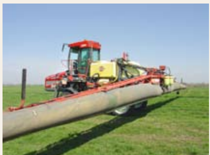
Obr. č. 15: Moderní aplikační zařízení jsou vybavena speciálními protiúletovými opatřeními

Další návody, jak dodržet jednotlivá omezení použití přípravků, lze nalézt na webu SRS http://www.srs.cz/portal/page/portal/SRS_Internet_CS/or