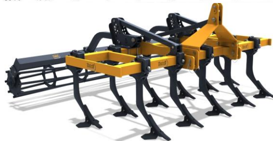
ilustrační foto DR11