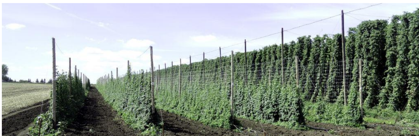
Poloprovozní plocha nízké chmelnicové konstrukce v Kněžicích u Žatce (17. 8. 2016).

ve středu 13. září 2017 od 10:00 hod v Kněžicích u Žatce, v sídle společnosti Kněžice č. p. 18 a u poloprovozní plochy nízké konstrukce.